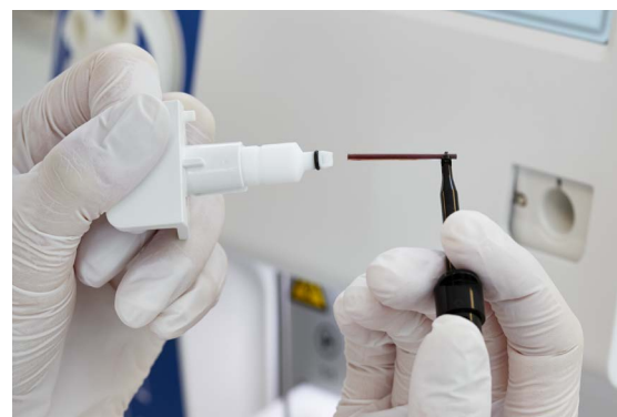
Общий клинический анализ крови всего из 20 мкл крови. Идеально для детей и банков крови

Как бы вам ни нравилось работать с анализатором Medonic, иногда вам придется оставлять его для самостоятельного анализа партии проб. Для таких случаев отличным прибором будет Medonic M32S с автозагрузчиком. Это первоклассная модель в серии Medonic M32, идеальный и прекрасный вариант для больниц с большим потоком исследований. Просто загрузите в анализатор до 2 x 20 проб и позвольте ему самому сделать всю работу!