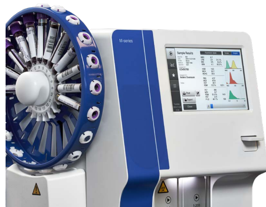
Medonic M32S с автозагрузчиком идеален для больниц с большим потоком исследований